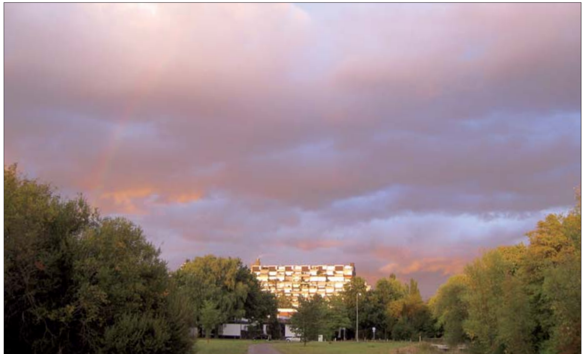
SONNENUNTERGANG: NP-Leserin Gabi Dubbert schickte uns dieses Foto von Davenstedt. Sie liebt es, schöne Radtouren und Spaziergänge in der Umgebung zu unternehmen.

Der Stadtteil-Blog unter http://john.neuepresse.de