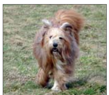
DOPPELGÄNGER: Skippy von Wolfgang Weber ist auch auf der Bult unterwegs.