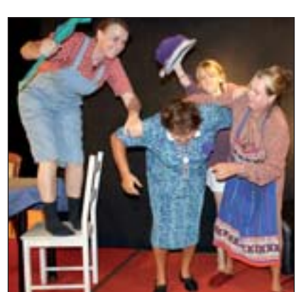
SÜDSTÄDTER KOMMÖDCHEN: Bei der Premiere am 16. Oktober gehts rund.